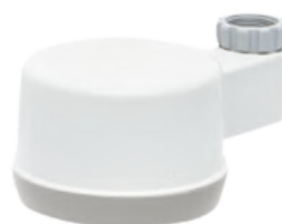
Zestaw startowy filtr kranowy legionella

Różne stalowe adaptory do montażu filtra legionella na istniejących kranach różnych marek