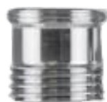
Zewnętrzny 1/2" do 22 mm