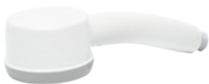
Zestaw startowy filtr prysznicowy legionella